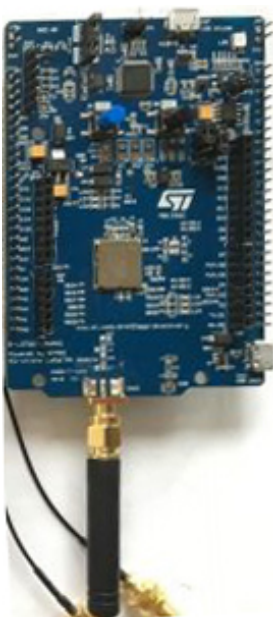
Antenne 868 MHz