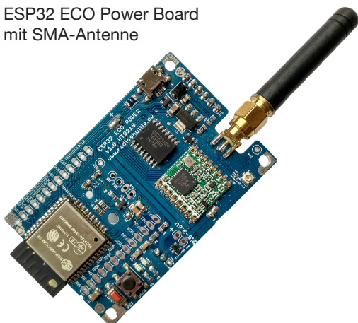
ESP32 ECO Power Board mit SMA-Antenne